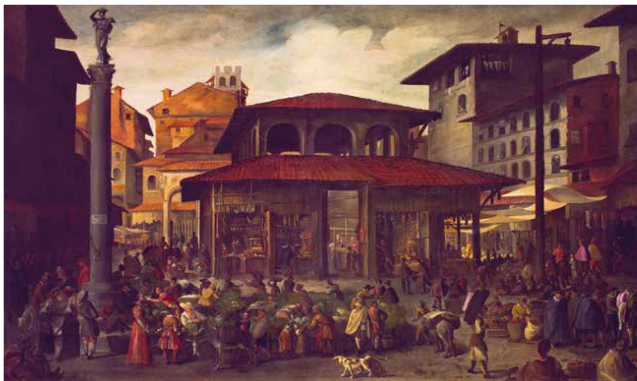
Attribuito a Filippo Angeli detto Filippo Napoletano, Veduta del Mercato Vecchio a Firenze, primo trentennio del Seicento